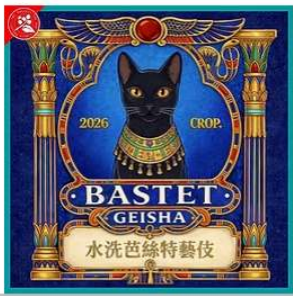
衣索比亞.芭絲特.藝伎水洗