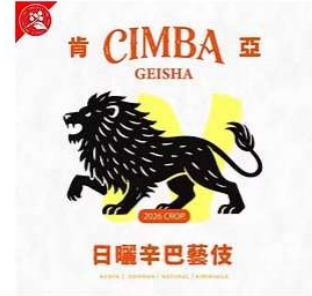
肯亞.辛巴.藝伎日曬