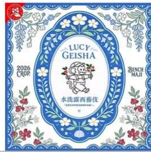
班奇馬吉.露西.藝伎水洗