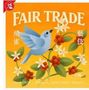
班奇馬吉.飛雀處理站.藝伎日曬